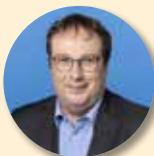
Oliver Krischer Minister für Umwelt, Naturschutz und Verkehr des Landes Nordrhein-Westfalen